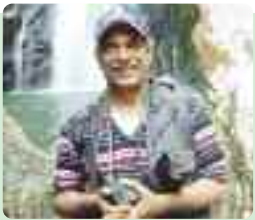
TEXTO Y FOTO: Juan Guzmán