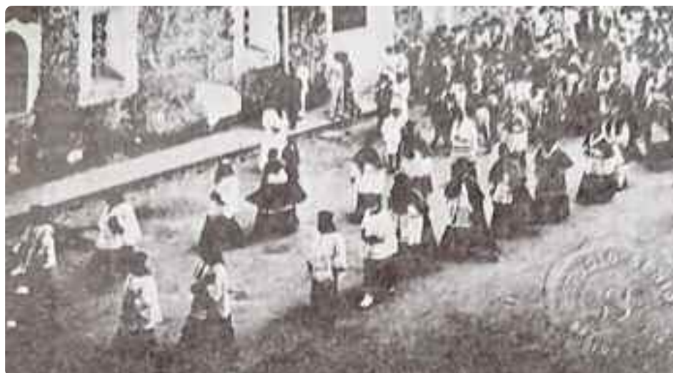
El Clero con la delegación pontificia y dignidades visitantes dirigiéndose a la Basílica para celebrar la solemne pontifical el día 15 de agosto de 1922

Esta última afirmación del jurado es importante situarla en el contexto de opresión y vasallaje en que se encontraba entonces el pueblo dominicano, tras seis años de oprobiosa intervención por parte del