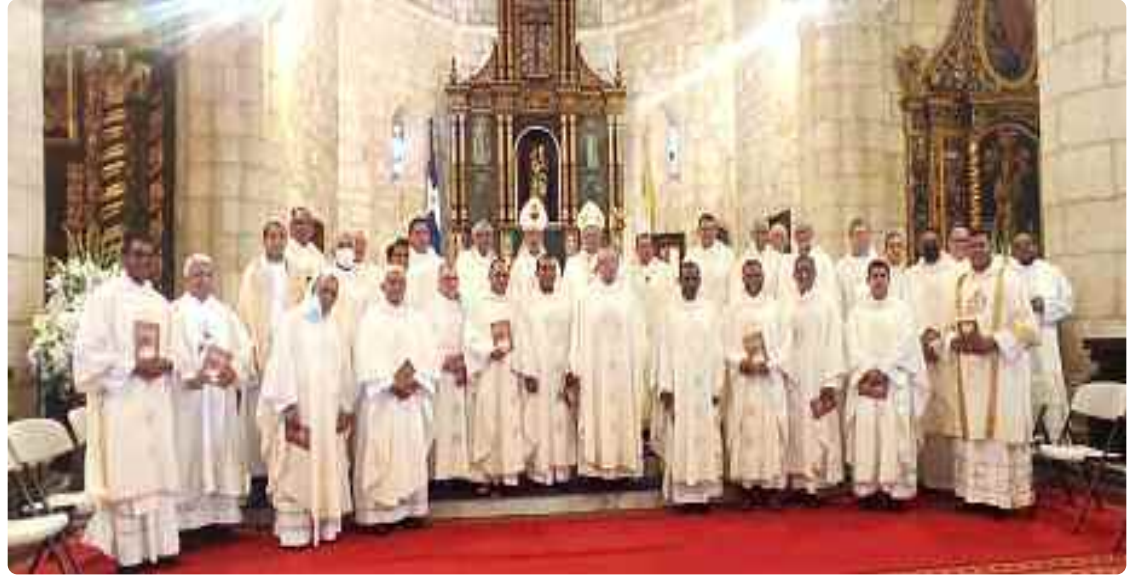
Concelebrantes de la Eucaristía en la Catedral Primada de América