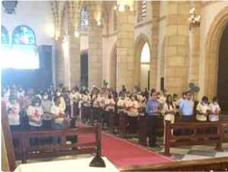
Asamblea participante en la Acción de Gracias