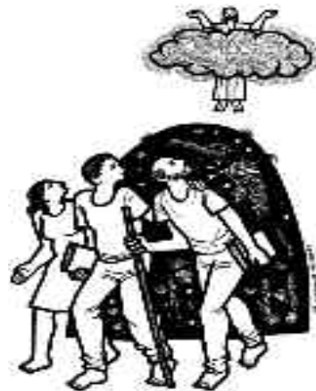
Nos toca ser testigos en medio de las luchas.

Jesús les pide a sus discípulos: “no se alejen de Jerusalén, aguarden que se cumpla la promesa de mi Padre”. Poco se podía esperar de Jerusalén, la ciudad asesina. Jesús les pide a sus discípulos que se queden ahí. Poco se puede esperar del enredado mundo de los negocios, de un Congreso lleno de próceres astutamente negados a declarar sus bienes o regular las bancas de apuestas antropófagas; de tanto medio de comunicación vendido;