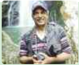
FOTO EN EL CAMINO