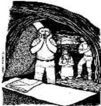
El Resucitado transformó su cobardía en audacia

Judíos y romanos rechazaron a Jesús y sus planteamientos. Igual lo hubiéramos hecho muchos de nosotros hoy en día. Lo condenaron a muerte como revoltoso y blasfemo. Judíos y romanos descalificaron a Jesús a partir de sus convicciones