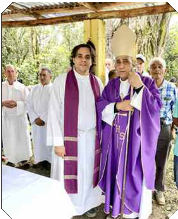
Caminata penitencial. Cacique, Juncalito

Pero la lista sería interminable si menciono uno por uno los encuentros. La actitud predominante de la gente frente a mí ha sido la de alegrarse, y la de ayudarme haciendo la carga lo más llevadera posible. Dios conoce a cada uno por su nombre y no dejará sin recompensa tanta generosidad hacia mí. Y esto vale tanto para los fieles laicos como para sacerdotes, religiosas, diáconos, presidentes de asamblea... Otra bendición grande ha sido la cercanía de mi familia.