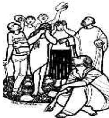
Jesús, un juez que devuelve a la vida.

La salvación es un cambio “de suerte”, como se cambia el llanto de los que sembraron y ahora cantan al cosechar. (Salmo 125).