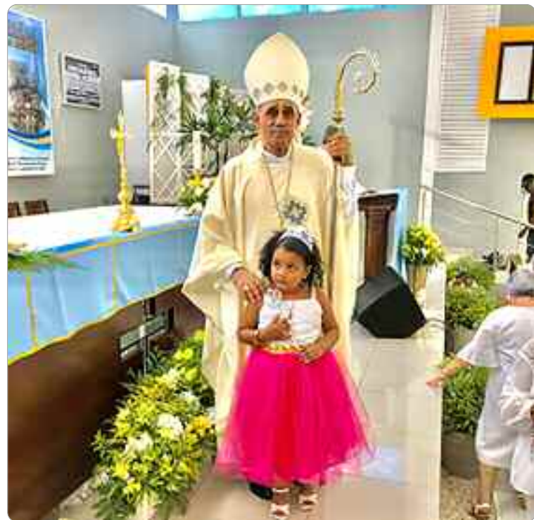
Casa Misión Divina Providencia y Las Mercedes, Santiago.