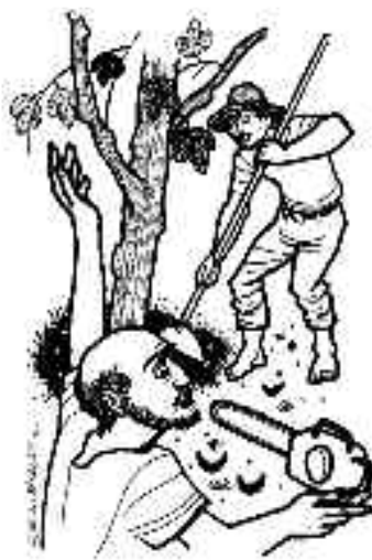
Cuaresma, urge cambiar desde adentro

En Egipto, los hebreos vivían como esclavos y padecían una dura servidumbre bajo crueles capataces. Dios se revela como Aquel que se interesa por la suerte de los que sufren y viene a cambiar su situación. Quiere “sacarlos de esa tierra de servidumbre, para llevarlos a una tierra fértil y espaciosa, tierra que mana leche y miel.” (Éxodo 3, 1 – 15).